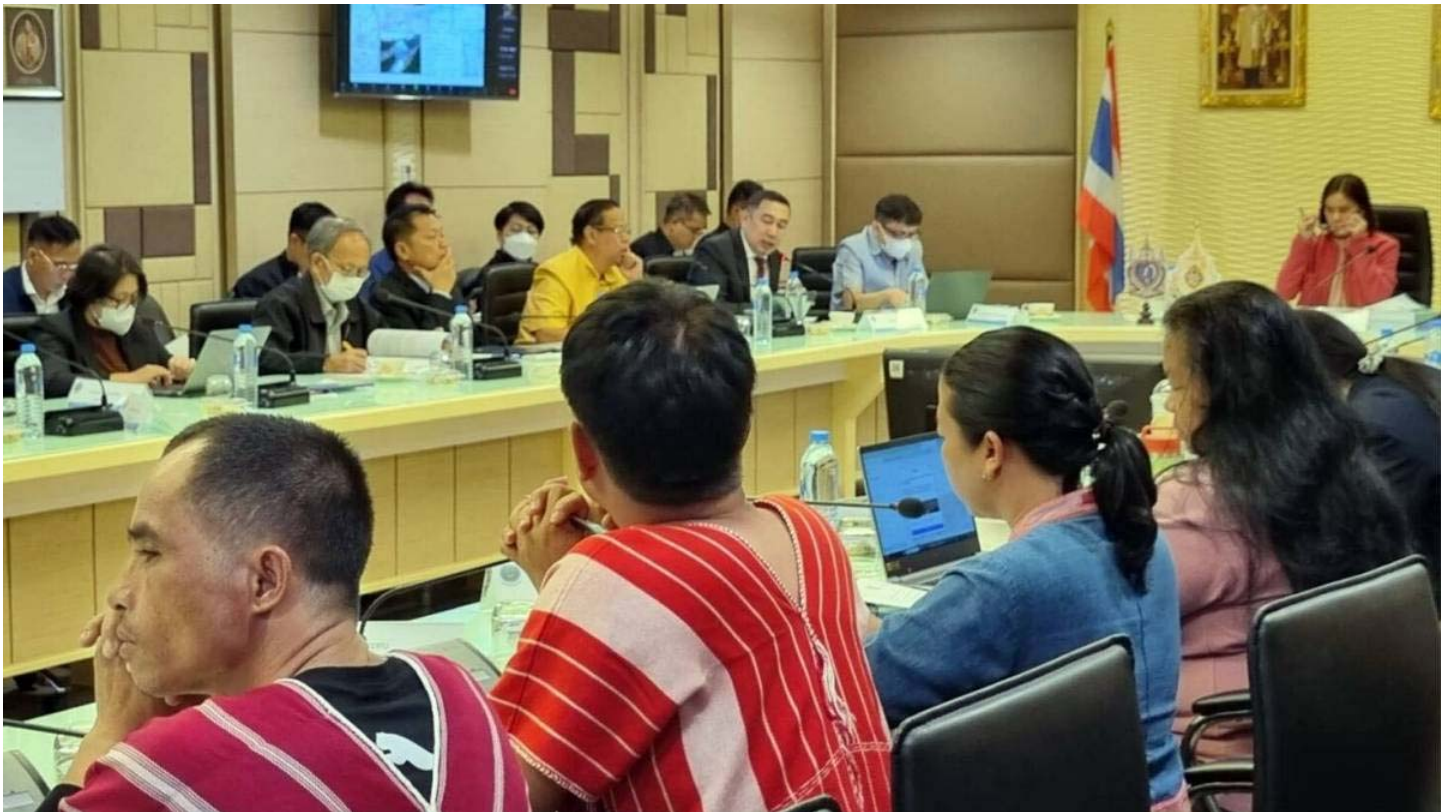
นักวิชาการ ชี้ โครงการผันน้ำยม แสนล้น เสี่ยงผิดกฎหมาย สร้างหนีมหาศาล

นักวิชาการ ชี้ โครงการผันน้ำยม แสนล้น เสี่ยงผิดกฎหมาย สร้างหนีรัฐมหาศาล ชาวบ้านสับแหลกกรมชลประทานบิดข้อมุล เตรียมตั้งคณะทำงานศึกษาใหม่ทบทวน 3 ประเด็น